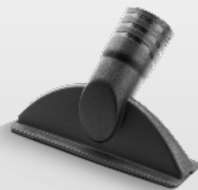
Düse für glatte Flächen Small nozzle for solid surfaces