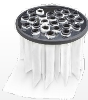
Multi Taschenfilter „M“ Multi filter class „M“