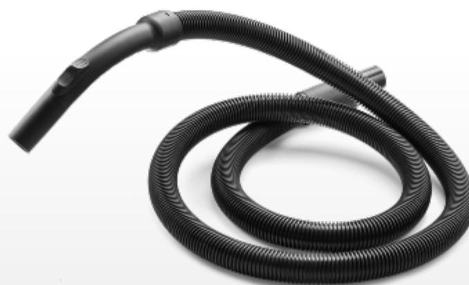
Saugschlauch 2,8 m Suction hose 2,8 m